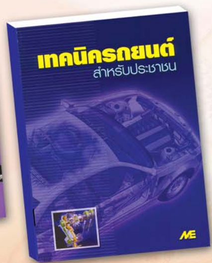
เทคนิครถยนต์สำหรับประชาชน